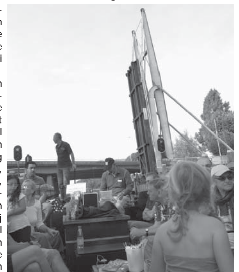
Passeren van de openstaande brug bij Koningshoeven