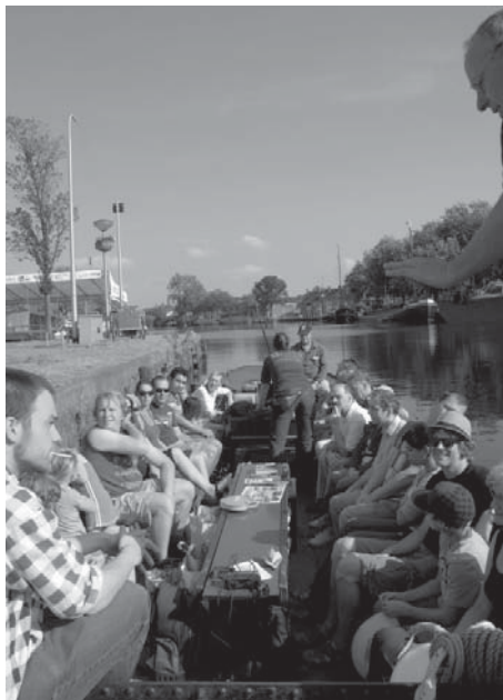
Blik op de Tilia vlak voor vertrek uit de Piushaven

Onze stadsgids wees ons al gauw op het RVS kunstwerk dat midden in het water van de Piushaven staat waar niemand eigenlijk van weet wat het nou precies betekent, maar het schijnt dat sommige mensen er naar refereren als zijnde een onderzeëer. Hierna verhaalde hij over de historische perikelen en