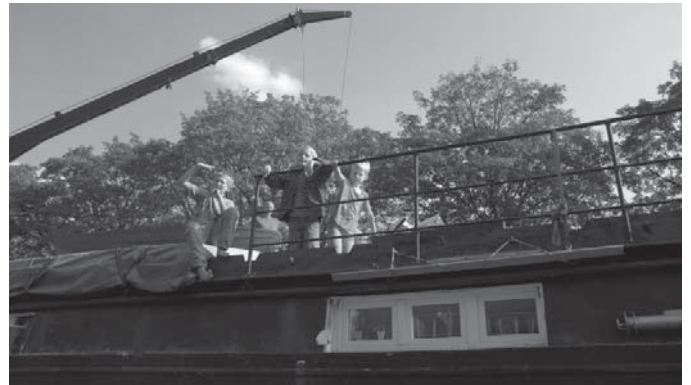
Historische boot met wuivende kinderen die we passeerden